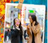
ถนนคนเดินชุนชี่