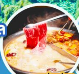
ชาบูหม่าล่า