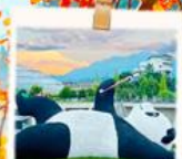
แพนด้าชิลลี่